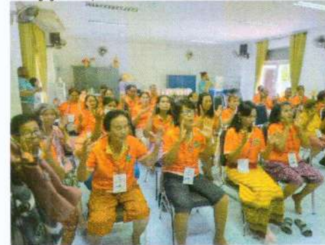
(๕๔) โครงการส่งเสริมคุณภาพชีวิตผู้สูงอายุ ผู้ป่วยเอดส์ ผู้พิการ ผู้ด้อยโอกาส งบประมาณ ๒๐,๐๐๐ บาท (ข้อบัญญัติ)