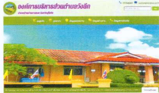
(๑๑๔) จัดซื้อเครื่องคอมพิวเตอร์ สำหรับประมวลผล จำนวน ๑ เครื่อง งบประมาณ ๒๔,๐๐๐ บาท