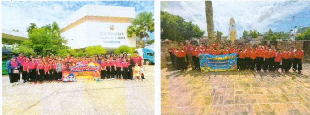
(๖๘) อุดหนุนโรงเรียนบ้านหนองตม โครงการทัศนศึกษาฯ งบประมาณ ๓๐,๐๐๐ บาท (ข้อบัญญัติ)