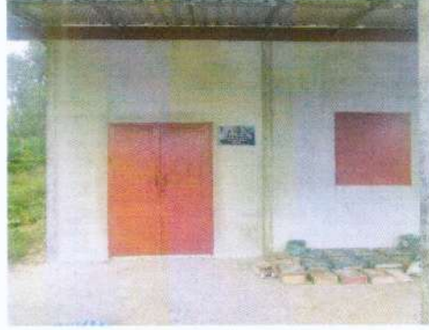
(๕๒) โครงการควบคุมโรคไข้เลือดออก งบประมาณ ๑๓,๑๐๗.๙๐ บาท (ข้อบัญญัติ)