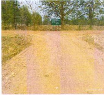
(๒๕) โครงการซ่อมแซมถนนลูกรัง สายหนองตุม - หนองรางป็น หมู่ ๗ บ้านหนองตุม งบประมาณ ๑๔๓,๐๐๐ บาท (จ่ายขาดสะสม)