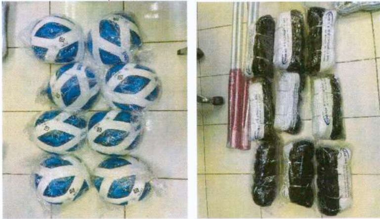
(๖๖) โครงการแข่งขันกีฬาตำบลวังลึก ด้านกายยาเสพติด งบประมาณ ๑๖๕,๘๕๐ บาท (ข้อบัญญัติ)