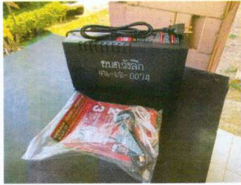
(๑๑๖) จัดซื้อเครื่องปริ้นเตอร์ งบประมาณ ๖,๕๐๐ บาท