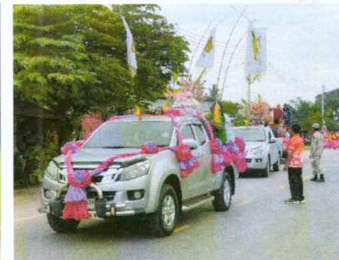
(๖๔) โครงการจัดงานวันเด็กแห่งชาติ งบประมาณ ๕๐,๐๐๐ บาท (ข้อบัญญัติ)