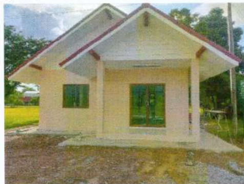
(๑๑๘) โครงการก่อสร้างอาคารอเนกประสงค์ อบต.วังลึก งบประมาณ ๖๘๗,๐๐๐ บาท (จ่ายขาดสะสม)