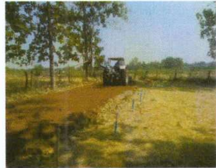
(๒๖) โครงการซ่อมแซมถนนลูกรัง สายบ้านนายละออง แป้นเกิด หมู่ ๗ บ้านหนองตุม งบประมาณ ๔๕,๐๐๐ บาท (จ่ายขาดสะสม)