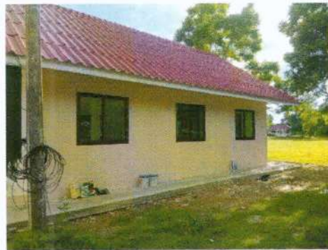
(๑๑๙) โครงการติดตั้งรางน้ำฝน อาคารโดมอเนกประสงค์ อบต.วังลึก งบประมาณ ๓๗,๕๐๐ บาท (จ่ายขาดสะสม)