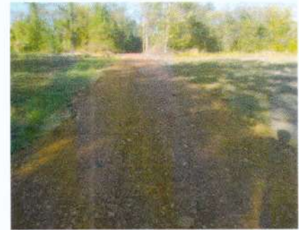
(๒๗) โครงการปรับปรุงซ่อมแซมถนนลูกรัง สายหนองเต่า - หนองตุม หมู่ ๗ บ้านหนองตุม งบประมาณ ๑๕๖,๐๐๐ บาท (จ่ายขาดสะสม)