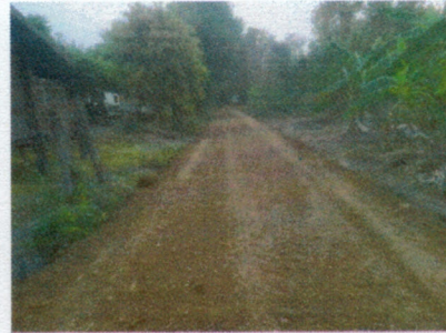
(๑๔) โครงการปรับปรุงซ่อมแซมท่อระบายน้ำคสล.บริเวณถนนลูกรัง สายเข้าในซัด - บ้านนางสายบัว สายทอง หมู่ ๕ บ้านหนองป่าแต้ว งบประมาณ ๒๗,๖๐๐ บาท (จ่ายขาดสะสม)