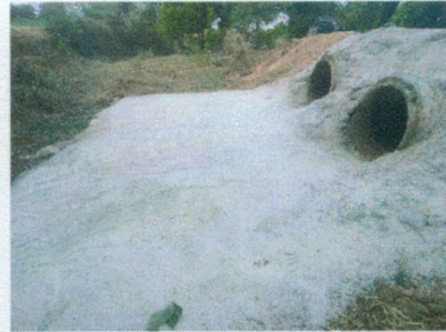
(๑๕) โครงการปรับปรุงซ่อมแซมท่อระบายน้ำ คสล.บริเวณถนนลูกรัง สายเข้าพื้นที่การเกษตร หมู่ ๕ บ้านหนองป่าแต้ว งบประมาณ ๑๓,๘๐๐ บาท (จ่ายขาดสะสม)