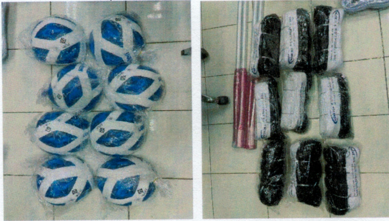
(๖๖) โครงการแข่งขันกีฬาตำบลวังลึก ด้านกายยาเสพติด งบประมาณ ๑๖๕,๘๕๐ บาท (ข้อบัญญัติ)