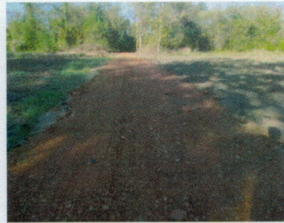
(๒๗) โครงการปรับปรุงซ่อมแซมถนนลูกรัง สายหนองเฒ่า - หนองตุม หมู่ ๗ บ้านหนองตุม งบประมาณ ๑๕๖,๐๐๐ บาท (จ่ายขาดสะสม)