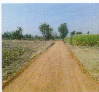
(๒๒) โครงการซ่อมแซมถนนลูกรัง สายไร่ นายสนั่น ไก่แก้ว - ไร่ นายเชาว์ บันลือ หมู่ ๖ บ้านหนองตม งบประมาณ ๓๖,๐๐๐ บาท (จ่ายขาดสะสม)