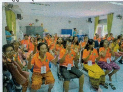
(๕๔) โครงการส่งเสริมคุณภาพชีวิตผู้สูงอายุ ผู้ป่วยเอดส์ ผู้พิการ ผู้ด้อยโอกาส งบประมาณ ๒๐,๐๐๐ บาท (ข้อบัญญัติ)