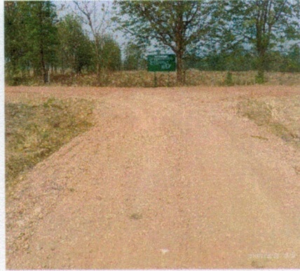
(๒๕) โครงการซ่อมแซมถนนลูกรัง สายหนองตุม - หนองรางป็น หมู่ ๗ บ้านหนองตุม งบประมาณ ๑๔๓,๐๐๐ บาท (จ่ายขาดสะสม)