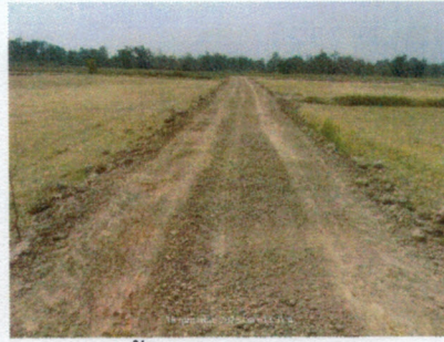
(๑๓) โครงการก่อสร้างถนนลูกรัง ซอยบ้านนายฉลอง มีมทอง หมู่ ๕ บ้านหนองป่าแต้ว งบประมาณ ๒๗,๐๐๐ บาท (จ่ายขาดสะสม)