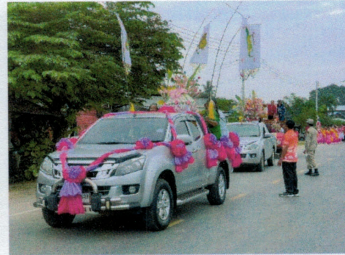
(๖๔) โครงการจัดงานวันเด็กแห่งชาติ งบประมาณ ๕๐,๐๐๐ บาท (ข้อบัญญัติ)