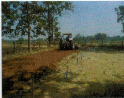
(๒๖) โครงการซ่อมแซมถนนลูกรัง สายบ้านนายละออง แปนเกิด หมู่ ๗ บ้านหนองตุม งบประมาณ ๔๕,๐๐๐ บาท (จ่ายขาดสะสม)