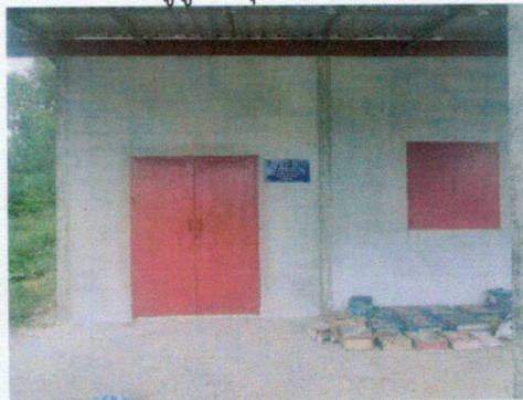
(๕๒) โครงการควบคุมโรคไข้เลือดออก งบประมาณ ๑๓,๑๐๗.๙๐ บาท (ข้อบัญญัติ)