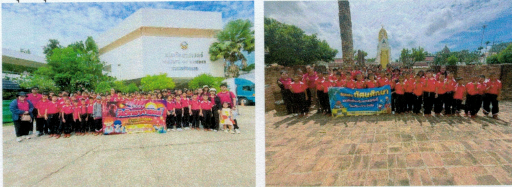
(๖๘) อุดหนุนโรงเรียนบ้านหนองตม โครงการทัศนศึกษา งบประมาณ ๓๐,๐๐๐ บาท (ข้อบัญญัติ)